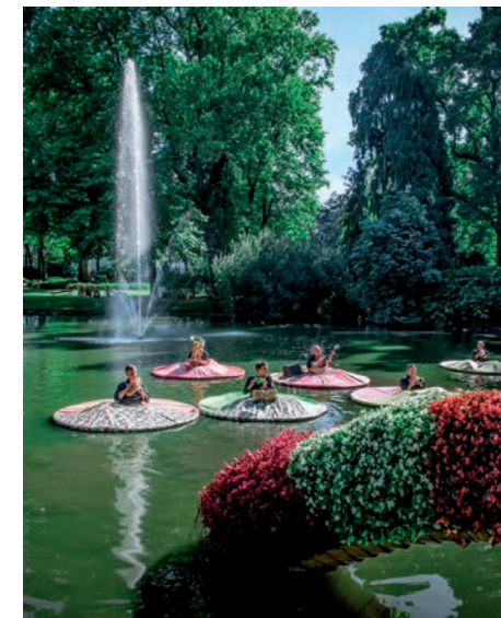
Agua Sonora © Stéphane Tasse

Samedi 19 sept. à 16h30, Île de Versailles, départ sur le quai de Versailles