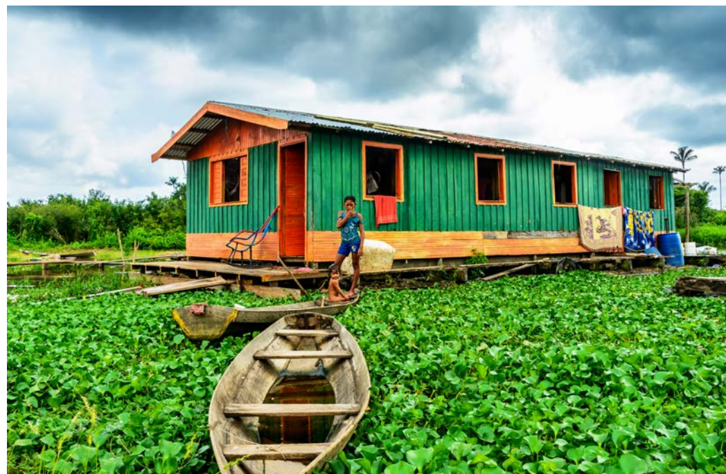
Manaus, le Fleuve est mon allié © Maria Ramos Ausier

* exposition présentée à la Cité des voyageurs, voir p.12