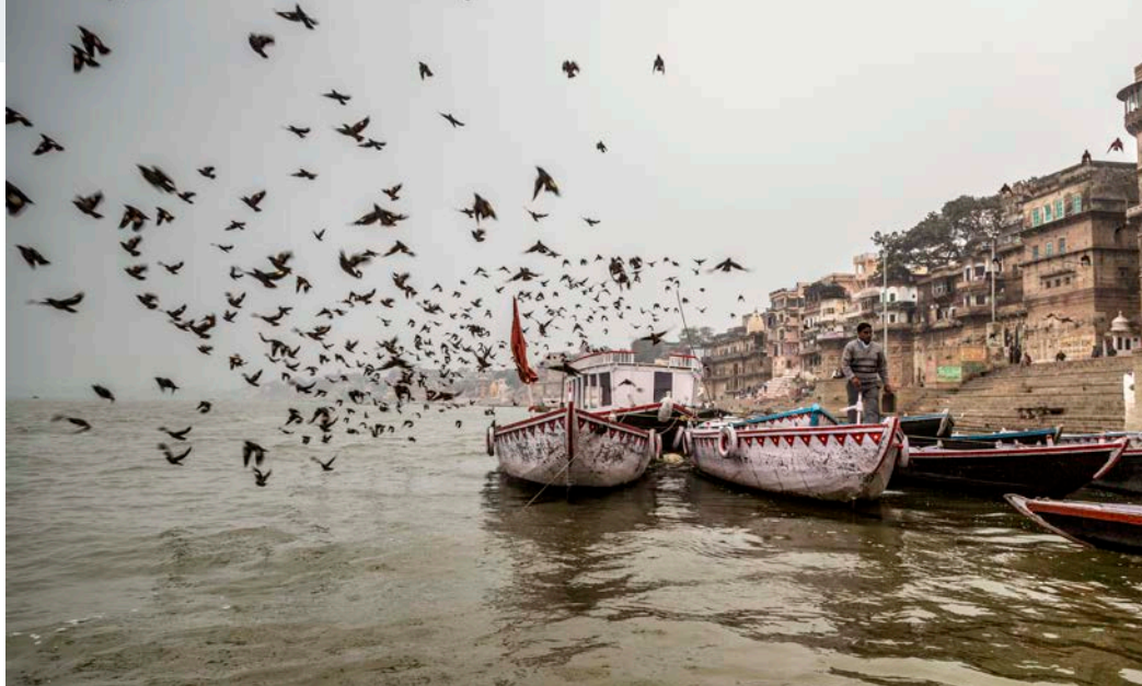
Le Gange

Projection suivie d'un échange avec Michel Cocotier, président de l'association Mémoire de l'Outre Mer Samedi 26 oct. à 15h