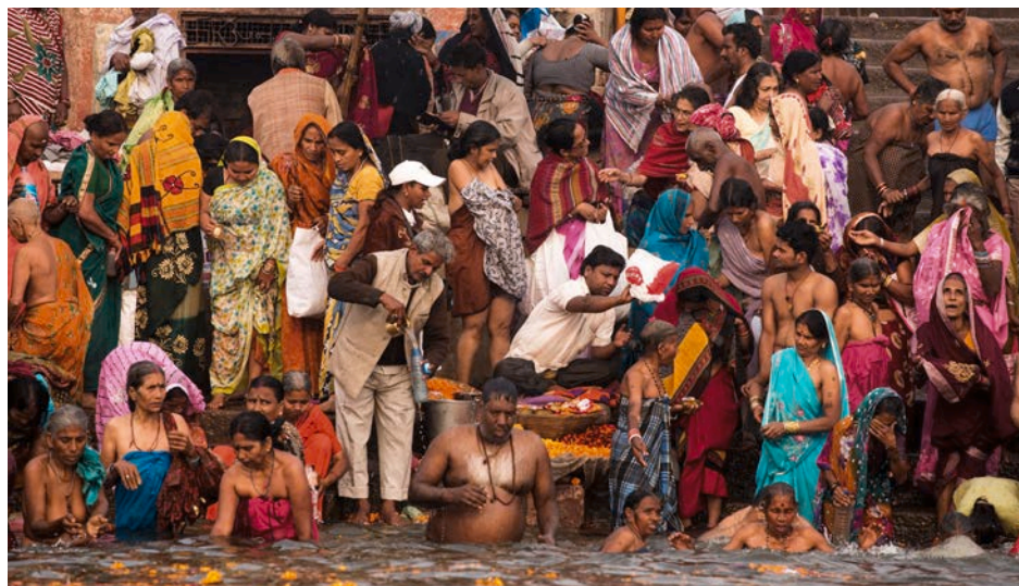
Le Gange

du lundi au vendredi de 13h30 à 18h, samedi et dimanche de 14h à 18h, Cosmopolis