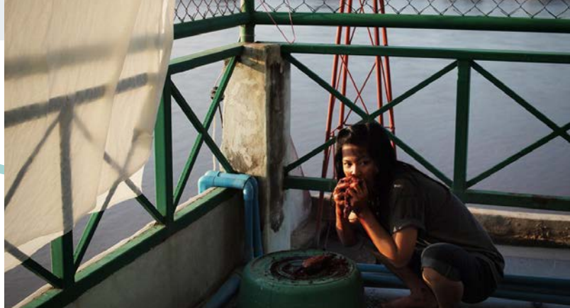
Mékong Hotel

Rens. et résa : 02 40 50 32 44, pilotiere@accoord.fr