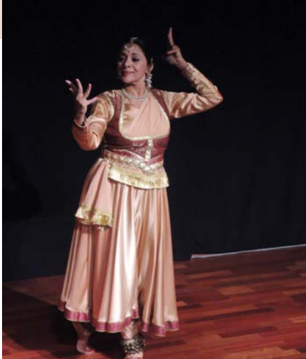
Malini Ranganathan © Cosmopolis