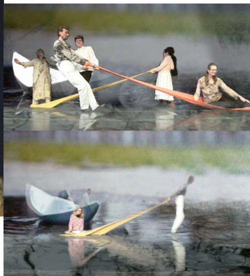
Au fil de l'eau - La Luna