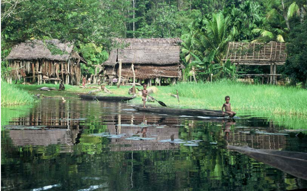
Le Sépik (Papouasie Nouvelle-Guinée)

Du 18 sept. au 13 nov. du lundi au vendredi de 9h à 12h30 et de 14h à 17h30