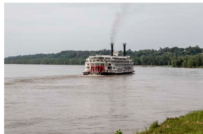
Le Mississippi