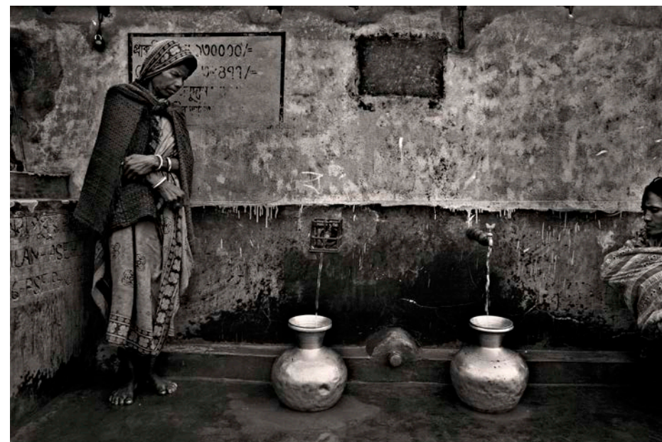
Larmes salées